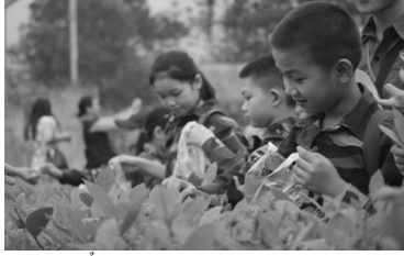
Ảnh minh họa/ Internet

chất của bản thân, đáp ứng được yêu cầu đổi mới của giáo dục.