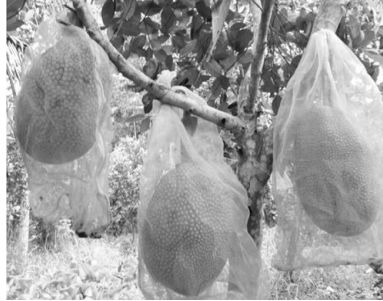
Mít được bao trái

trồng cây lên mô đất. Do mít Thái có khả năng cho trái sớm nên có thể trồng theo mật độ dày, khoảng 3,5m x 3,5 m hoặc 4 m x 4 m. Sau khi thu hoạch mít từ 5 – 7 năm, có thể loại bỏ cây ở giữa, đảm bảo mật độ giữa các cây mít luôn thông thoáng, giúp cây phát triển và đậu trái tốt hơn.