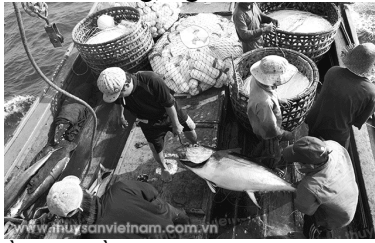
Cần có nhiều chính sách bảo vệ ngư dân trong quá trình hoạt động sản xuất trên biển.

Thủy sản chiếm vị trí quan trọng trong chiến lược phát triển kinh tế và an ninh quốc phòng biển, đảo. Năng lực sản xuất thủy sản ngày càng phát triển, cả nước hiện có trên 110.000 tàu thuyền nghề cá, trong đó tàu khai thác xa bờ hơn 30.000 chiếc; Thủy sản trở thành ngành kinh tế sản xuất hàng hóa lớn và chủ động tham gia hội nhập kinh tế quốc tế; đã góp phần chuyển đổi cơ cấu kinh tế nông nghiệp, nông thôn, xóa đói giảm nghèo và giải quyết việc làm cho hơn 5 triệu lao động, nâng cao đời sống vật chất và tinh thần cho nông, ngư dân.