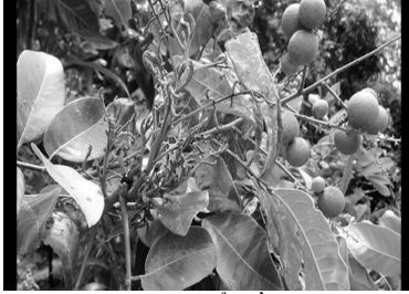
Nhân bị bệnh chói rỗng gây hại.

Bệnh gây hại nặng đến năng suất, chưa có thuốc đặc trị và phòng ngừa là chính.