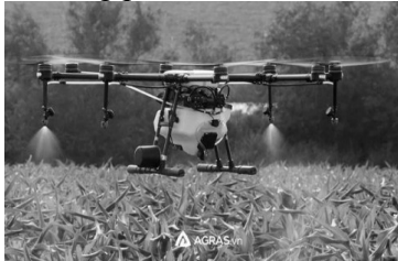
Thiết bị bay không người lái trong lĩnh vực nông nghiệp.

Thiết bị bay nông nghiệp (máy bay - theo Agras) nói chung có cấu trúc nhỏ gọn, tích hợp các thiết bị tự động hóa, đảm nhiệm một số khâu công việc chăm sóc cây trồng, ở mọi loại địa hình, khí hậu với năng suất làm việc cao, chất lượng phục vụ tốt.