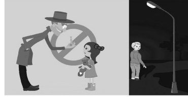
Không nhận quà của người lạ

cần phải đề cao việc giáo dục giới tính, kỹ năng sống cho con hơn bao giờ hết.