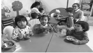
Để cho các em học sinh có một bữa ăn an toàn rất cần trách nhiệm của Hiệu trưởng.