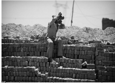
Cần uống nước đều đặn trong suốt thời gian làm việc khi nắng nóng.

- Ở mức độ nặng: cần gọi ngay cấp cứu 115 hoặc nhanh chóng đưa nạn nhân đến cơ sở y tế gần nhất. Lưu ý trong quá trình vận chuyển thường xuyên chườm mát cho nạn nhân.