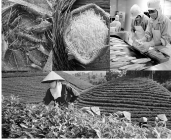
Gạo và chè Việt Nam đã xây dựng được thương hiệu quốc gia, nhưng mức độ gia tăng giá trị xuất khẩu chưa đạt như mong muốn.

Theo Cục Chế biến và Phát triển thị trường nông sản, Bộ Nông nghiệp và Phát triển nông thôn (NN&PTNT), các thị trường siết chặt yêu cầu về chất lượng, kiểm nghiệm kiểm dịch... đối với nông, thủy sản nhập khẩu đang đặt ra thách thức rất lớn cho hoạt động sản xuất hàng nông sản xuất khẩu của Việt Nam.